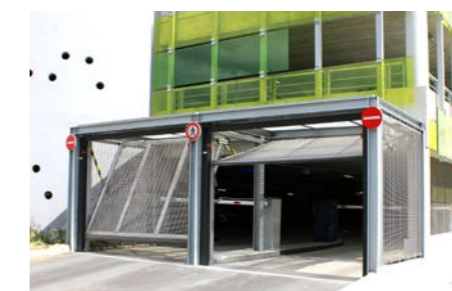
tablier avec grillage ou caillebotis