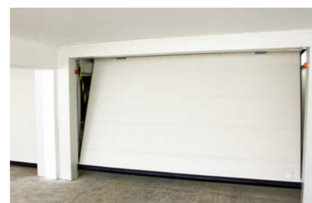
tablier avec panneaux isolants 40mm