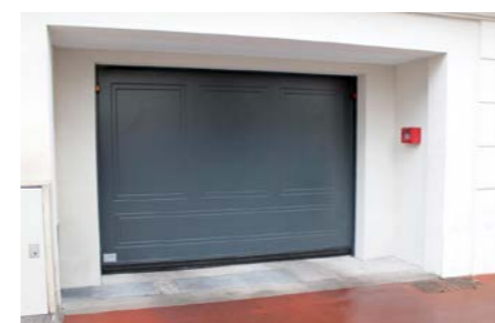
tablier avec remplissage bois