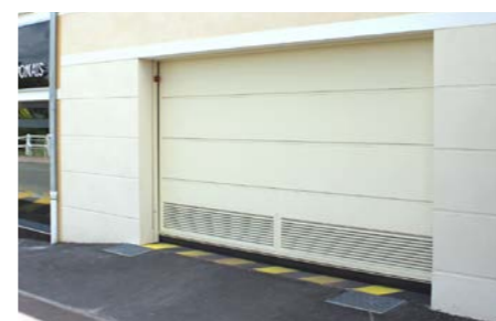
tablier avec tôles lisses ou tôles lisses joints creux