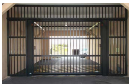
tablier en barreaux ronds, carrés ou losanges