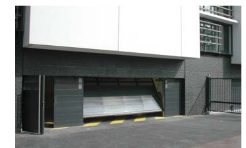
tablier avec tôles lisses pleines ou perforées